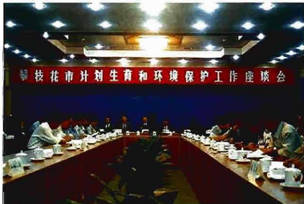
1998年4月18日，市委、市政府召开全市计划生育与环境保护座谈会