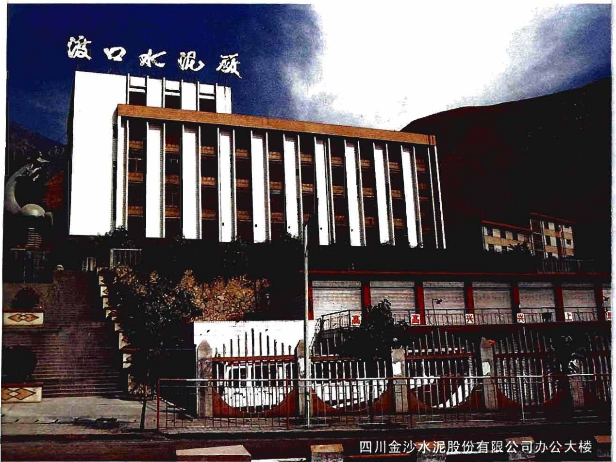
四川金沙水泥股份有限公司办公大楼