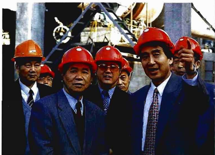
公司总经理纪荣杯（右一）陪同四川省委书记谢世杰（左二）视察公司生产情况