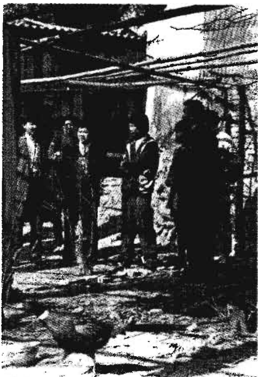
深入农户家中宣传计生工作

的距离也不会有大的变化。因此,“天下第一难事”的计划生育的基本状况没有变,其长期性、艰巨性没有变。