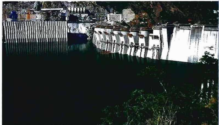
二滩电站大坝全部采用公司生产的“攀枝花牌”水泥浇筑