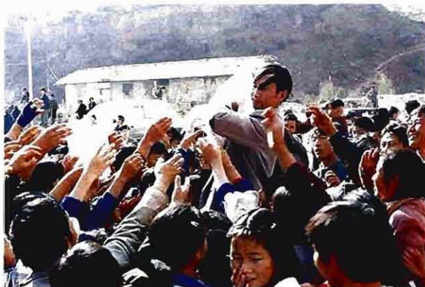
1999年1月8日，市计划生育委员会“科技、文化、卫生三下乡”盐边县渔门镇现场宣传活动