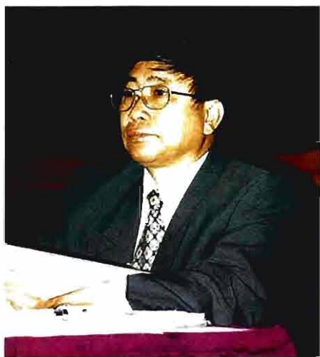
市计划生育委员会主任 林尚琪